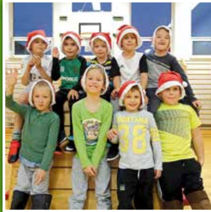
Hopsi Hopper (6 – 10 Jahre), Mittwoch 16 – 17 Uhr