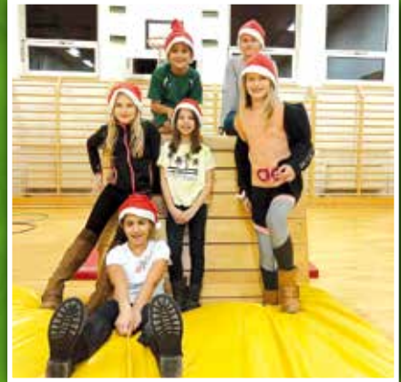
Fun Aerobic & Dance (10–14) Mi. 17:15 – 18:15 Uhr