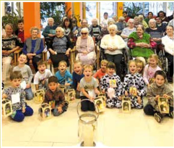
Am 12. November besuchten die Kindergartenkinder das Pflegeheim in Oberpullendorf und begeisterten die SeniorInnen mit Liedern.