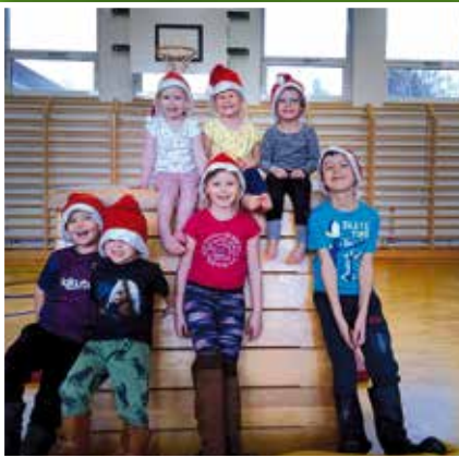
Hopsi Hopper (3 – 6 Jahre) Mittwoch 15 – 16 Uhr

Jeden Mittwoch "wurlt" es im Turnsaal der Volksschule, da sporteln die Jüngsten unserer Gemeinde.