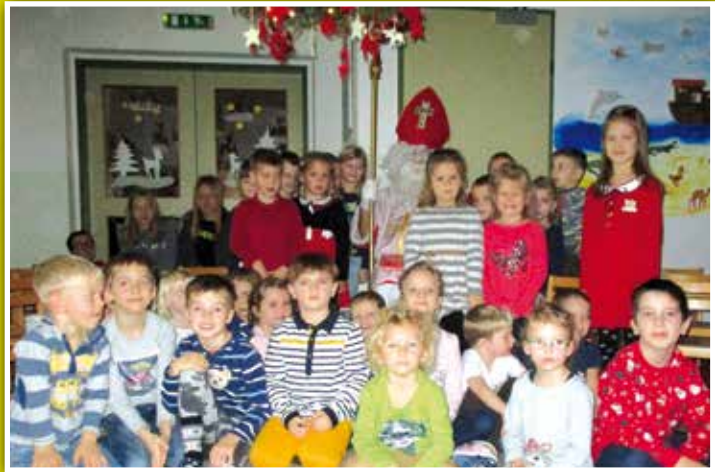
Wie immer am 6. Dezember besuchte der Nikolaus den Stoober Kindergarten und natürlich bekam jedes Kind ein Nikolaussackerl mit kleinen Geschenken überreicht.