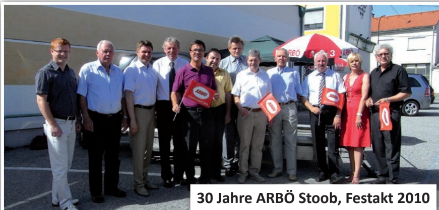
30 Jahre ARBÖ Stoob, Festakt 2010