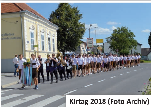
Kirtag 2018

Deswegen hat sich der Vorstand der Burschenschaft Stooß entschieden, das gesamte Kirtagswochenende abzusagen. Pläne fürs nächste Jahr werden aber schon geschmiedet!