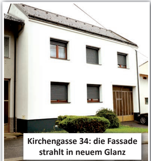
Kirchengasse 34: die Fassade strahlt in neuem Glanz

Falls Sie vorhaben, Ihre Hausfassade zu erneuern, denken Sie daran, dass es noch immer den Zuschuss der Gemeinde gibt. Einfach im Gemeindeamt den Förderantrag ausfüllen. Sie bekommen die Kosten für die Straßenseite nach einem Förderschlüssel erstattet. Die Förderung kann einmal innerhalb von 10 Jahren in Anspruch genommen werden. Der Fördersatz pro Quadratmeter straßenseitige Fassade beträgt 4,50 Euro.