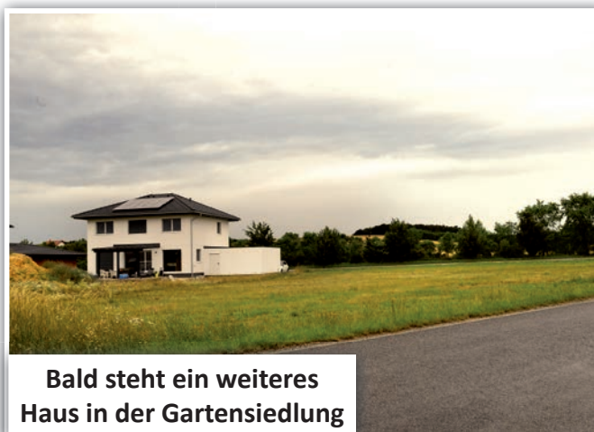
Bald steht ein weiteres Haus in der Gartensiedlung

Zur Verwirklichung des Projektes „Erweiterung Töpfermuseum – Kittingbau“ ist eine Zwischenfinanzierung für zugesagte Fördermittel notwendig. Hierfür beschließt der Gemeinderat die Aufnahme eines Darlehens von der Raiffeisenbank Mittelburgenland in Höhe von 300.000 €. Dieses soll spätestens bis 31.12.2023 durch zufließende Fördermittel für obiges Projekt getilgt werden.