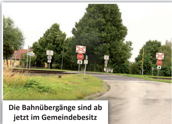
Die Bahnübergänge sind ab jetzt im Gemeindebesitz

Hinsichtlich des Voranschlages 2020 berichtet Bürgermeister Stutzenstein über Einnahmeherausfälle bezüglich der Ertragsanteile bzw. Kommunalsteuern und