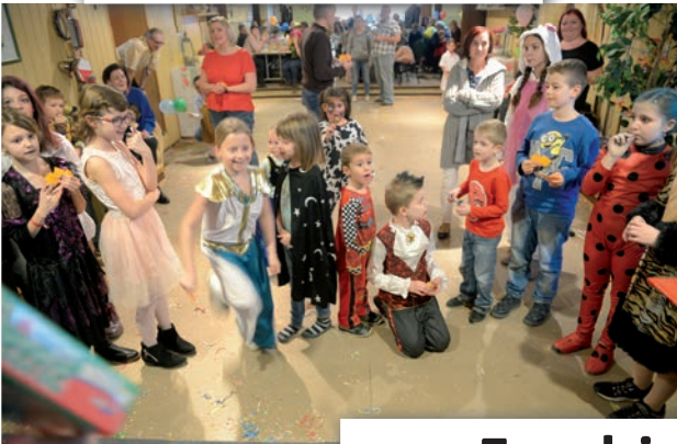
Kindermaskenball der SPÖ Stoob im Stooberhof