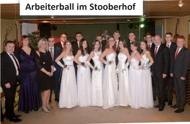
Arbeiterball im Stooberhof