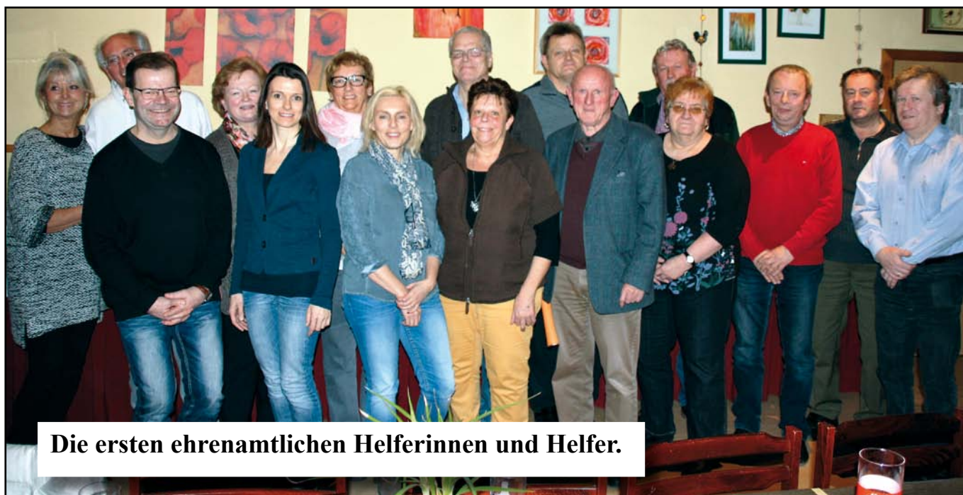
Die ersten ehrenamtlichen Helferinnen und Helfer.