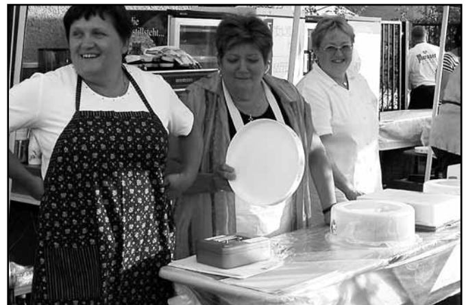
Äußerst begehrt waren die Mehlspeisen die von den Damen liebevoll zubereitet und dargeboten wurden