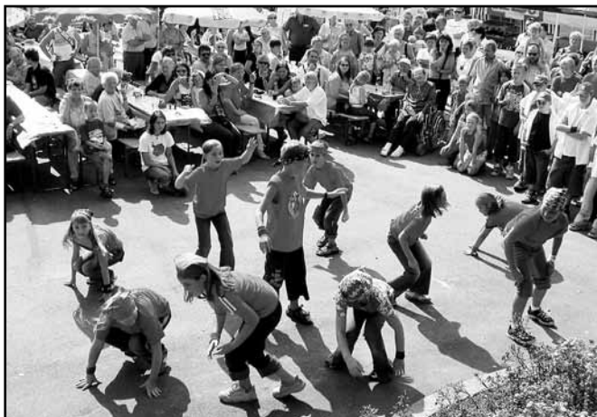
Die Showdance-Vorführung der Stoober Kinder stieß auf große Begeisterung