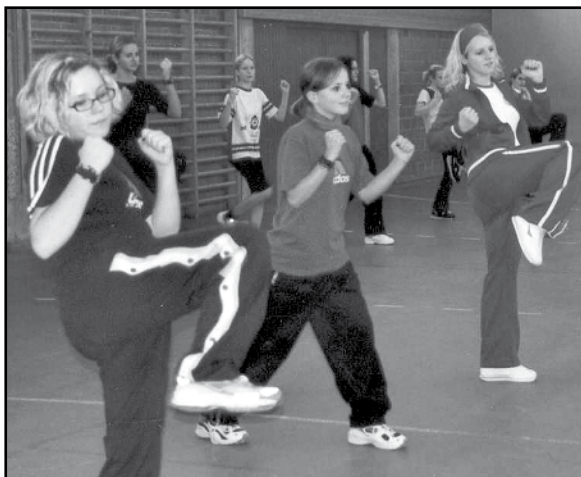
“Und kick!” Wehrhafte junge Frauen beim Selbstverteidigungskurs im Turnsaal der Stoober Hauptschule

Einen Grundkurs in Selbstverteidigung absolvieren zur Zeit die Mädchen der 4. Klasse in der Hauptschule Stoob. Das soll den Mädchen helfen, sich effizienter gegen Belästigungen zur Wehr setzen zu können. Die Ausbildung führen die Revierinspektoren Markus Schunerits und Peter Reitgruber durch.