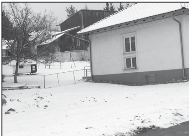
Hier sollen Parkplätze entstehen

das laufende Finanzjahr über 284.000 Euro wurde beschlossen. Dieser betrifft vor allem die Ausgaben für die Instandhaltungsarbeiten am Rathaus, den Ausbau der Ortsdurchfahrt, die