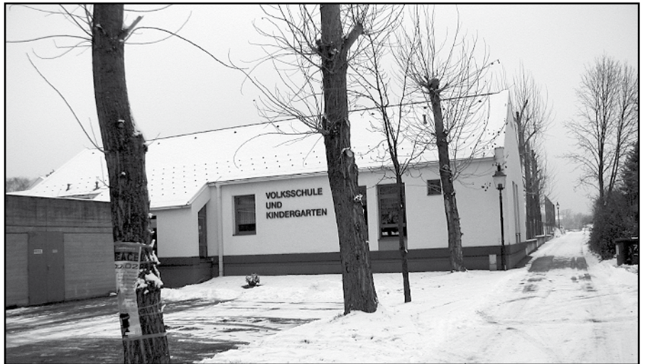
Der Kindergarten - vor 10 Jahren erbaut und nun zu klein. Das Land hat die Stoober Kinderzahlen falsch eingeschätzt.

Über 60 Kinder werden in Kürze unseren Kindergarten besuchen, und da die Gemeindeverantwortlichen mit Bgm. Stutzenstein an der Spitze jedem Kind einen Kindergartenplatz ermöglichen wollen, soll mit den Verantwortlichen des Landes eine 3. Gruppe