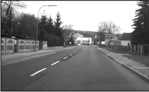
Raser sollen in Zukunft eingebremst werden

Stoob soll und wird die Lebensqualität der geplagten Anrainer erheblich verbessert werden.