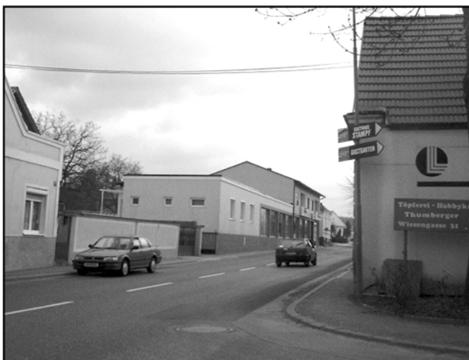
Die Straße wird schmaler gemacht, dafür werden die Gehsteige breiter und Parkplätze geschaffen

den bei den beiden Ortseinfahrten Verkehrsinseln errichtet, die den Durchzugsverkehr "einbremsen" sollen. Und im gesamten Ortsgebiet werden 50 km/h die höchste erlaubte Geschwindigkeit sein.