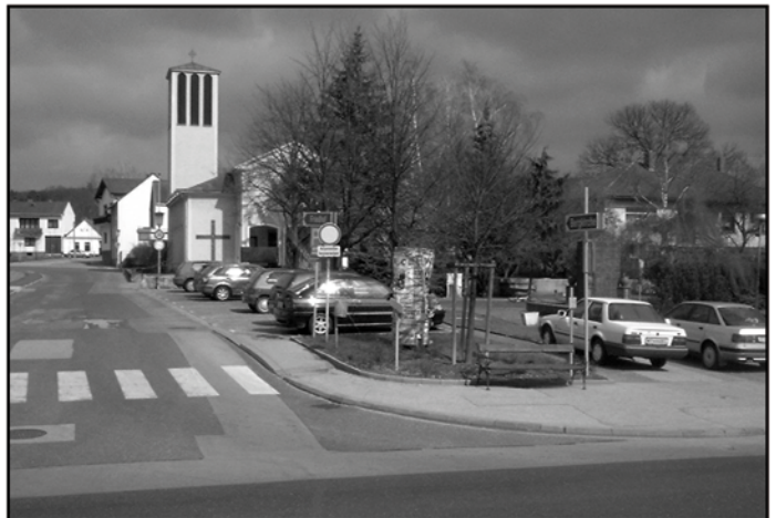
Auch der Hauptplatz soll neu gestaltet werden

Nähere Details zu den Umbauarbeiten erfahren sie bei einer Bürgerversammlung, die in den nächsten Wochen abgehalten wird. Der genaue