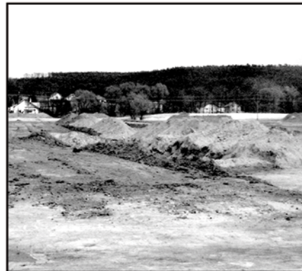
Die Arbeiten sind bereits voll im Gange

Für die Benutzer des Radweges heißt dies jedoch, dass sie ihn diesen Sommer leider nicht verwenden können.