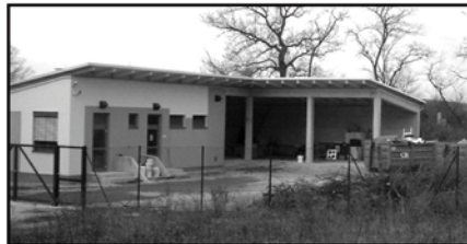
Nicht in unsere schönen Wälder sondern hierher mit dem Müll. Altstoffsammelstelle: jeden Samstag von 9 - 12 Uhr

welt für uns alle geschaffen werden. Die Organisatoren würden sich wünschen, daß die Notwendigkeit eine Flurreinigung durchzuführen, sich allmählich erübrigen würde.